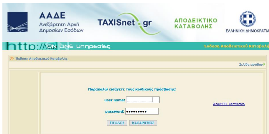
Εικόνα 2: Είσοδος στην εφαρμογή

Καταχωρώντας τους κωδικούς πρόσβασης του χρήστη (φυσικό ή νομικό πρόσωπο ή νομική οντότητα).