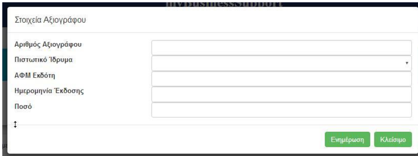
Εικόνα 3:Οθόνη εισαγωγής στοιχείων αξιογράφου

Στην οθόνη της αίτησης (εικόνα 2 και 3):