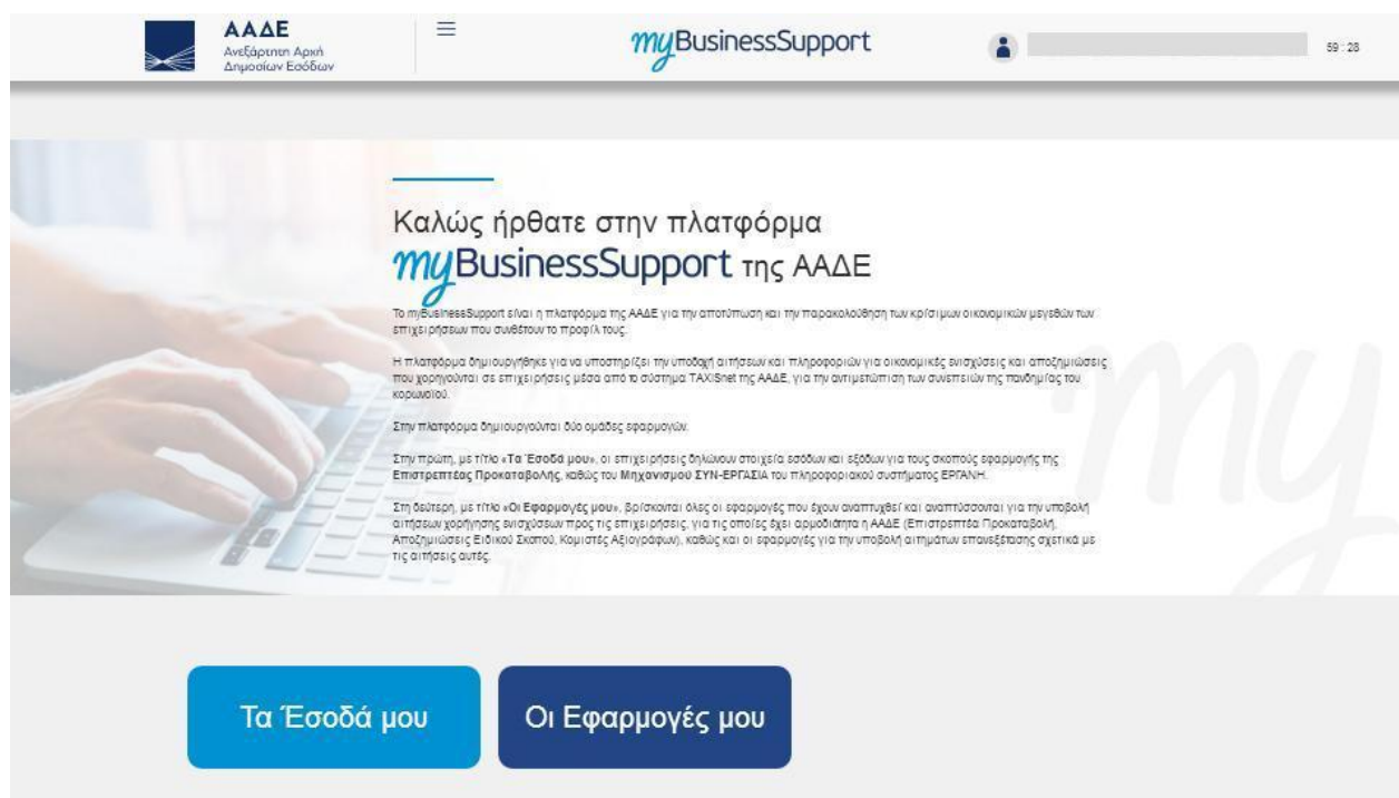
Εικόνα 1 : Σελίδα της πλατφόρμας στον διαδικτυακό τόπο της ΑΑΔΕ

Η σελίδα της εφαρμογής στο διαδικτυακό τόπο της ΑΑΔΕ είναι η παρακάτω. Για την είσοδο ο ενδιαφερόμενος επιλέγει «Οι εφαρμογές μου»