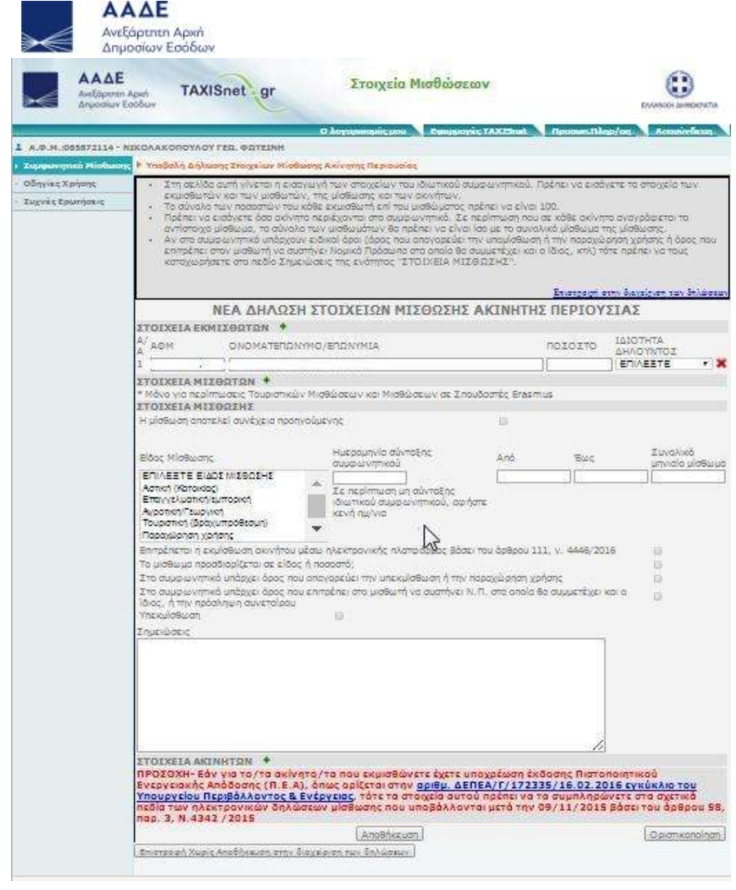
Εικόνα 2 : Οθόνη υποβολής δήλωσης Πληροφοριακών Στοιχείων Μίσθωσης Ακίνητης Περιουσίας

Στη δήλωση περιλαμβάνονται τα παρακάτω πεδία, τα οποία στην περίπτωση αρχικής δήλωσης συμπληρώνονται (εκτός και αν συμπληρωθεί ο ΑΤΑΚ του ακινήτου) από τον χρήστη και στην περίπτωση τροποποιητικής δήλωσης ή δήλωσης Covid προσυμπληρώνονται από την εφαρμογή.