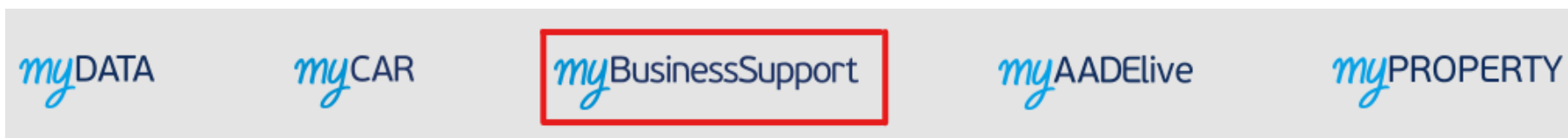
Εικόνα 1. Πρόσβαση στην υπηρεσία myBusinessSupport.

Η Εφαρμογή προσφέρεται ως εφαρμογή του Ο.Π.Σ. TAXISnet της ΑΑΔΕ και η είσοδος σε αυτήν πραγματοποιείται με τη χρήση των προσωπικών κωδικών του TAXISnet.