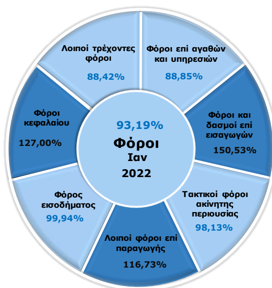
Γράφημα 5: Επίτευξη στόχων των επτά επιμέρους κατηγοριών εσόδων από φόρους για τον Ιανουάριο 2022

Πηγή δεδομένων: Γενικό Λογιστήριο του Κράτους