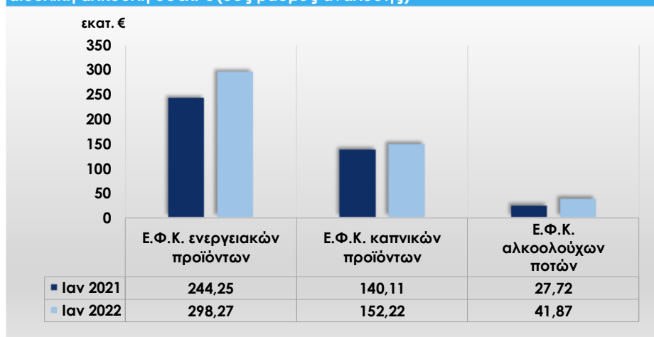
Γράφημα 2: Σύγκριση βασικών αναλυτικών λογαριασμών εσόδων από Φ.Π.Α. στα πετρελαιοειδή προϊόντα και στα παράγωγα αυτών, στα καπνικά προϊόντα και στην αιθυλική αλκοόλη σε εκ. € (5ος βαθμός ανάλυσης)

Στο γράφημα, παρουσιάζονται αναλυτικά οι μεταβολές των εσόδων από Φ.Π.Α. στα προϊόντα πετρελαίου και παραγώγων αυτού, καπνού και αιθυλικής αλκοόλης, λόγω της σημαντικότητάς τους στο σύνολο των εσόδων της εν λόγω κατηγορίας.