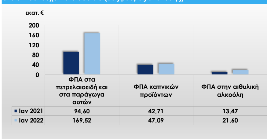
Γράφημα 3: Σύγκριση εσόδων από Ε.Φ.Κ. στα ενεργειακά προϊόντα, στα καπνικά προϊόντα και στα αλκοολούχα ποτά σε εκ. € (5ος βαθμός ανάλυσης)