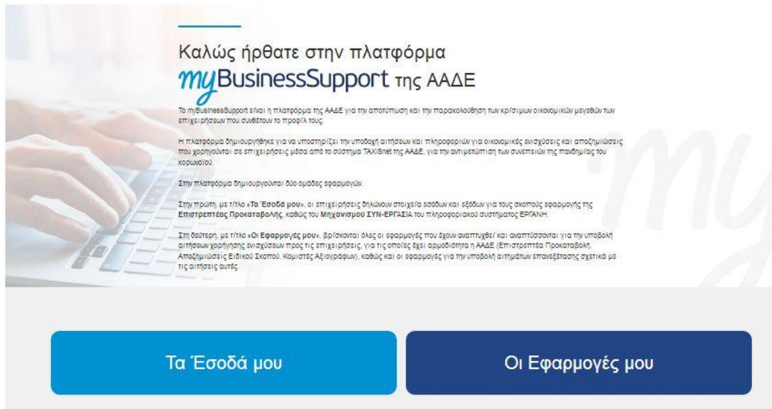
Εικόνα 1. Είσοδος στην πλατφόρμα “myBusinessSupport”

Για την είσοδο στην εφαρμογή, επιλέγετε «Οι εφαρμογές μου».