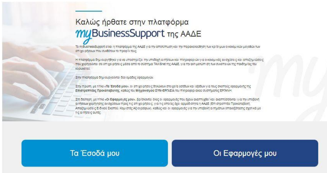
Εικόνα 1. Είσοδος στην πλατφόρμα “myBusinessSupport”

Για την είσοδο στην εφαρμογή, επιλέγετε «Οι εφαρμογές μου».