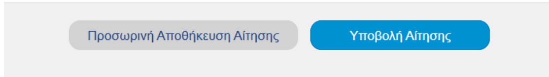
Εικόνα 9. Επιλογή υποβολής αίτησης

Προκειμένου να υποβάλετε αίτηση, θα πρέπει απλώς να «πατήσετε» στο πεδίο «Υποβολή αίτησης».